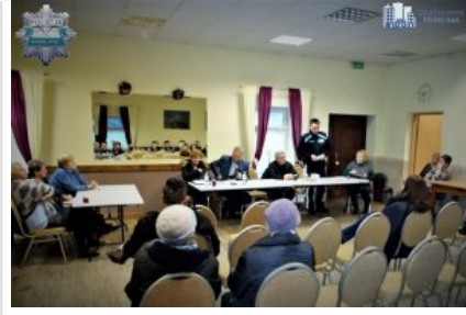
Spotkanie z mieszkańcami Stróży