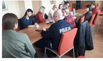
policjanci z przedstawicielami szkół rozmawiają na temat bezpieczeństwa