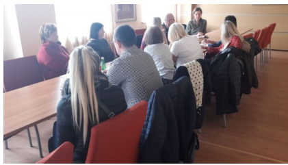
policjanci omawiają funkcjonowanie Krajowej Mapy Zagrożenia Bezpieczeństwa