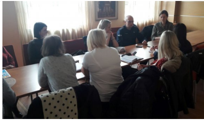
spotkanie w Urzędzie Miasta i Gminy w Koluśkach