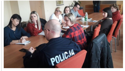
policjanci omawiają funkcjonowanie Krajowej Mapy Zagrożenia Bezpieczeństwa