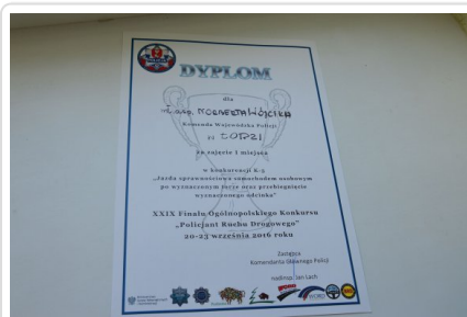
Najlepszy policjant w Polsce w konkurencji jazdy sprawnościowej