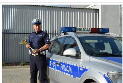
Najlepszy policjant w Polsce w konkurencji jazdy sprawnościowej