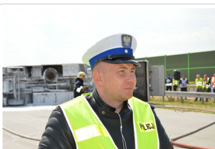
Najlepszy policjant w Polsce w konkurencji jazdy sprawnościowej