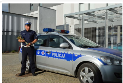
Najlepszy policjant w Polsce w konkurencji jazdy sprawnościowej